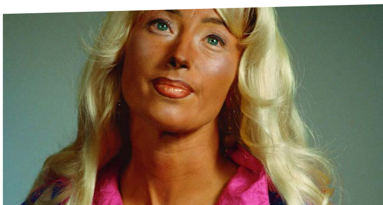
Cindy Sherman, « Untitled 397 ».

Aujourd'hui reconnue comme l'une des photographes vivantes les plus influentes de sa génération, Cindy Sherman a quelque chose de très singulier : la fantaisie ou l'audace de se métamorphoser et de se ridiculiser parfois. Débordant d'imagination et jamais à court d'idées, c'est avec second degré qu'elle déconcerte l'œil du spectateur.