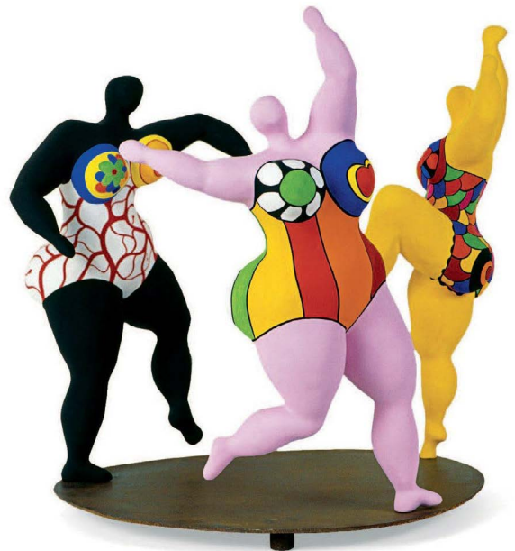
Niki de Saint-Phalle, « Les trois Grâces », 1994